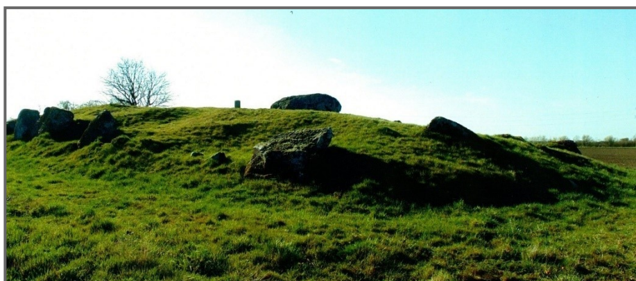
Lammedyssen 2014. Bemærk, at den store bæresten mangler her.