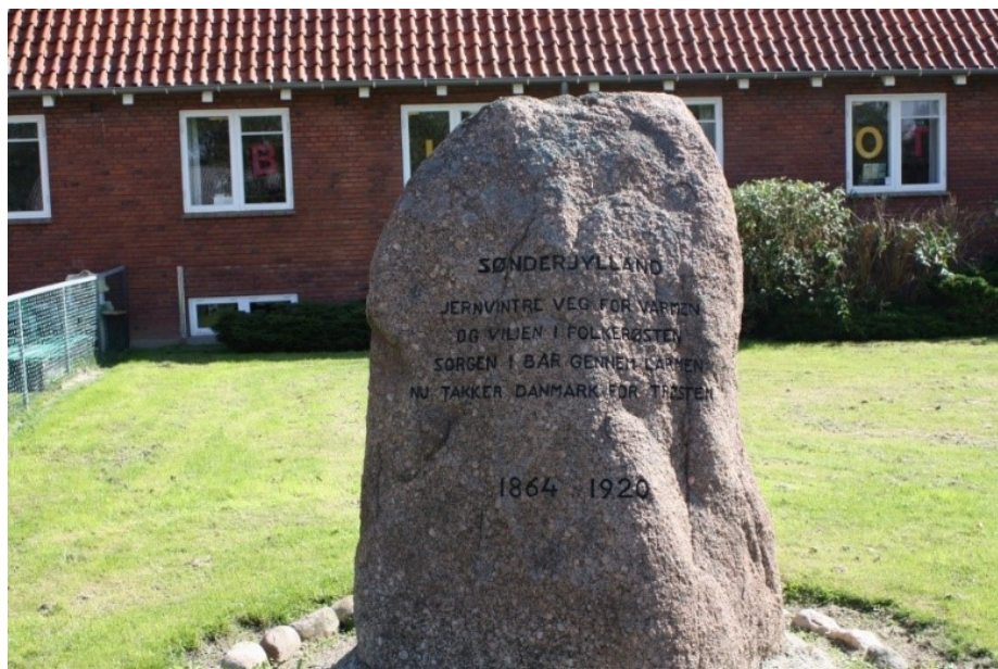
Genforeningsstenen foran Ågerup Bibliotek, 2014.