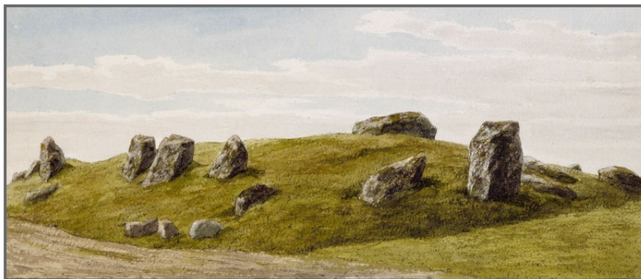
Akvarel af Lammedyssen, malet af A.P. Madsen ca. 1900. Her står den store bæresten stadig tydeligt i højre side af billedet.

Alle lokale borgere i Ågerup – og sikkert også mange andre, som bor i Roskilde området - kender til genforeningsstenen, som i dag er placeret ved Ågerup Bibliotek. Men historien bag den 5 tons store kampesten er der sikkert kun få, der har kendskab til, og stenen har haft en noget omskiftelig placering i lokalområdet.