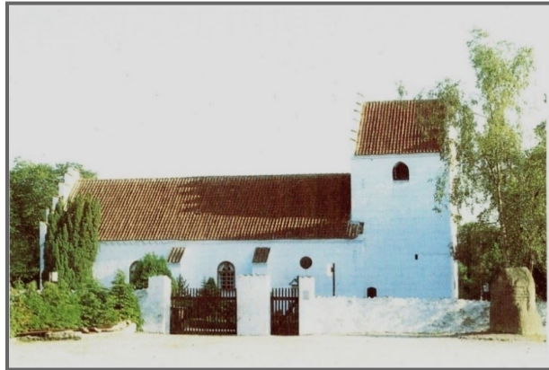
Ågerup Kirke ca. 1952, med genforeningsstenen til højre i billedet.