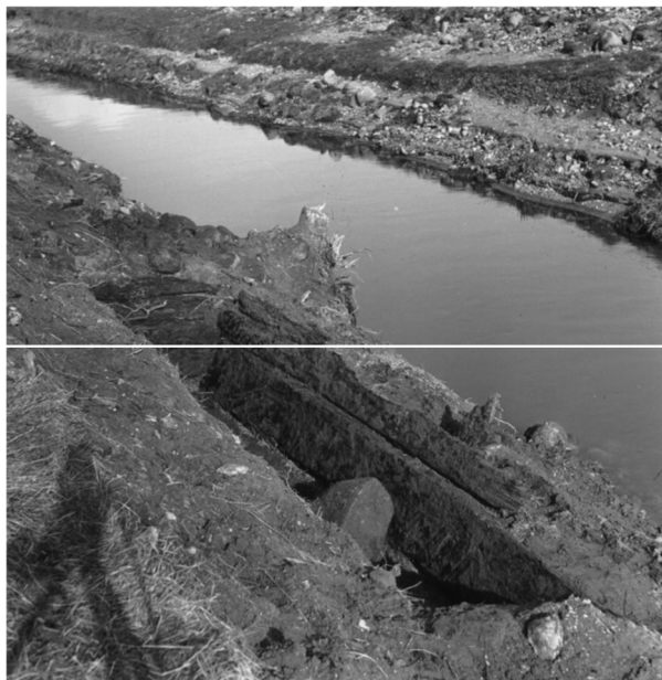
Nationalmuseets foto af brokassen el. ”brokarret” i 1950 - Fjordmuseet.

Bladet slutter: ”Skulle nogen inden for Roskilde Dagblads læserkreds kunne give oplysninger om den mystiske bro af sten og om, hvor dens materiale måtte være havnet, vil redaktionen gerne modtage sådanne”.