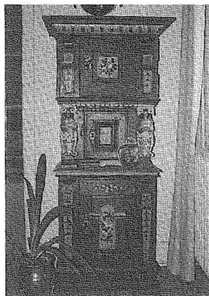
Stolpeskabet fra 1642, som det for kort siden stod i en af gårdens stuer i Ll. Valby.

Herunder foto af omtalte pennetegning fra nabogården i 1847. Stueinteriøret er tegnet af H.J.Hammer.